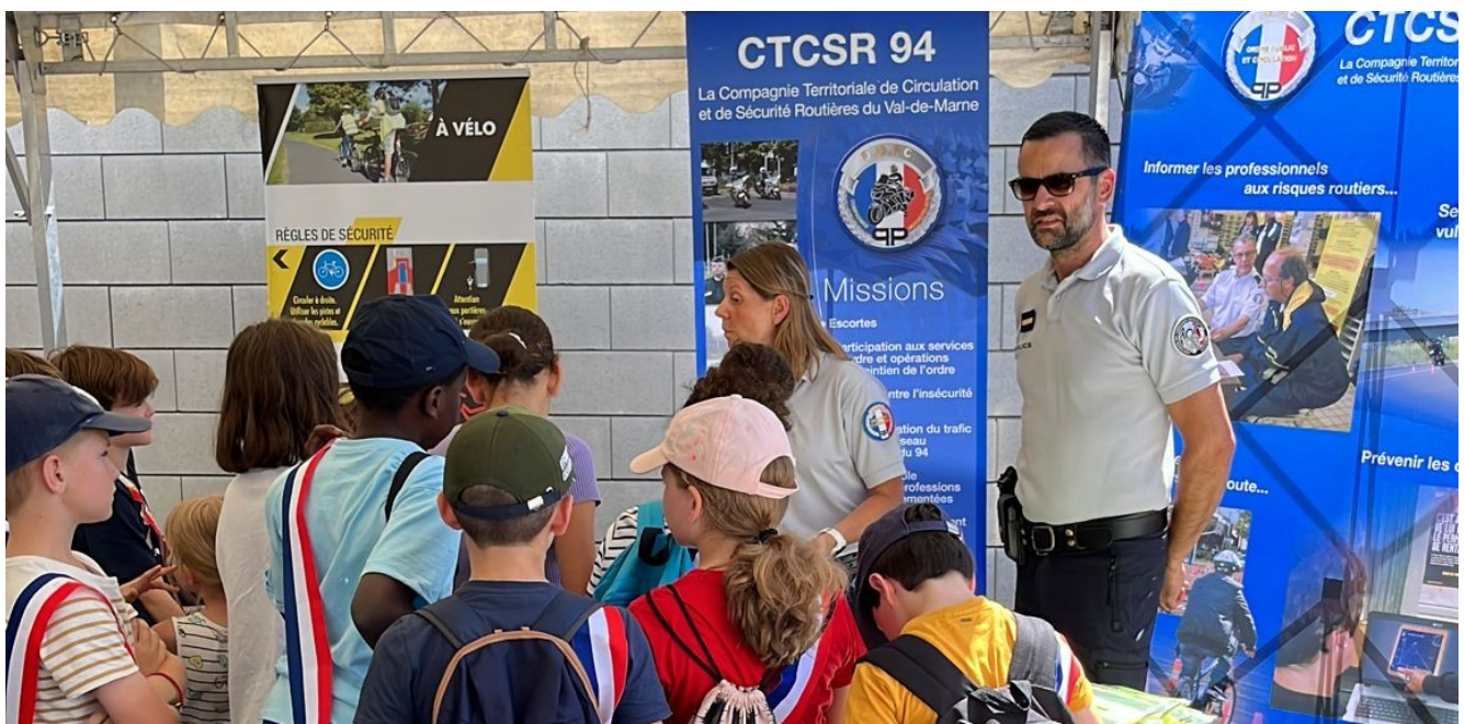
Action organisée au commissariat de Saint-Maur-des-Fossés en juin 2022

De telles opérations seront organisées sur l'ensemble du département d'ici la fin de l'année. Outre les actions traditionnelles et nécessaires d'alerte sur les risques des addictions, le plan départemental prévoit également le développement de la sensibilisation à de nouveaux usages, en particulier les trottinettes électriques.